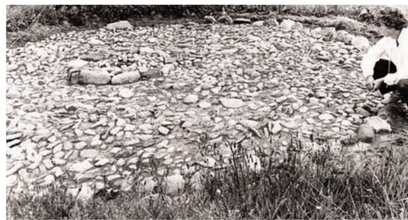
Æltepladsen fra Bolding Teglværk

På hjørnet af Stødbækvej og Boldingvej var Bolding Teglværk, som var ejet af Endrupholm Gods. Eksempelvis kom murstenene til tårnet på Åstrup Kirke – 1792, fra Bolding Teglværk. På modsatte side kan man i dag se de eneste rester af teglværket - æltepladsen, som er en rund brolagt plads med en egestolpe i midten. På den brolagte plads har en æltevogn kørt rundt, trukket af heste eller stude. Således blev leret æltet før det blev formet, og stenene lagt til tørre på skråningen.