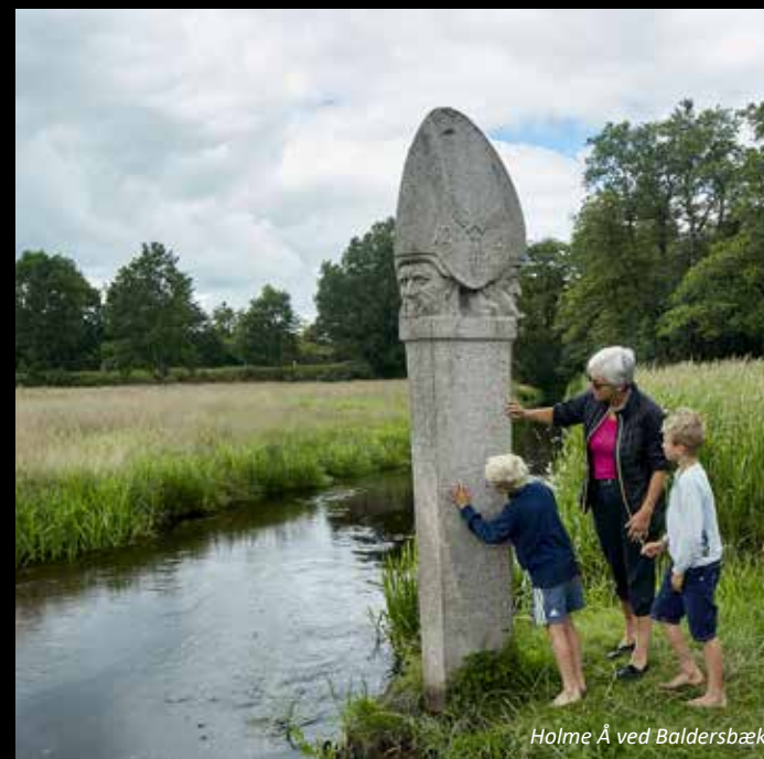
Holme A ved Balderisbæk