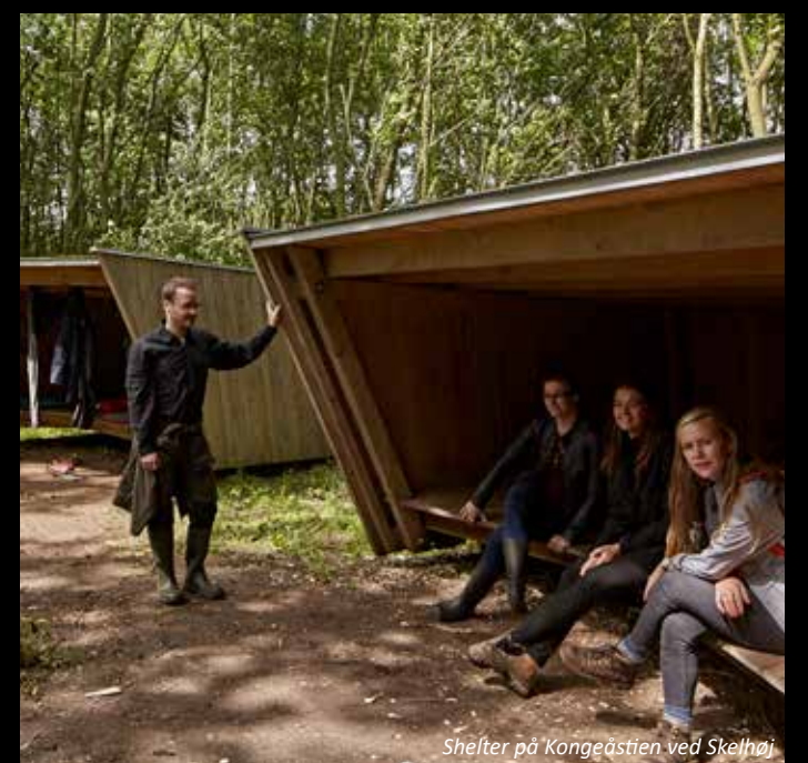
Shelter på Kongeåen ved Skelbøl