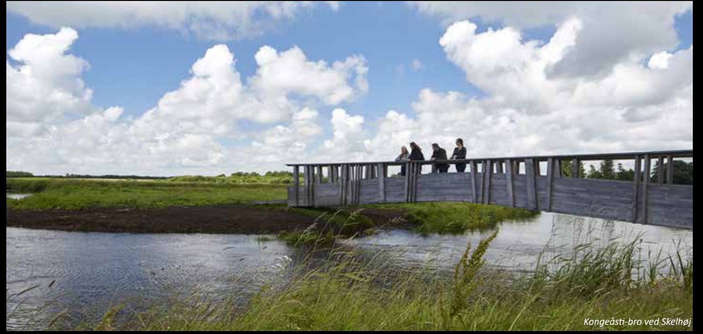
Kongeåsti-bro ved Skelbøl