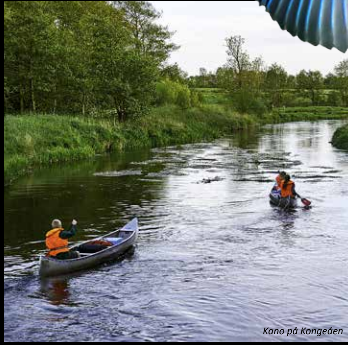
Kano på Kongeåen