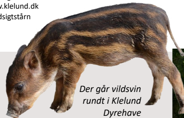
Der går vildsvin rundt i Klelund Dyrehave